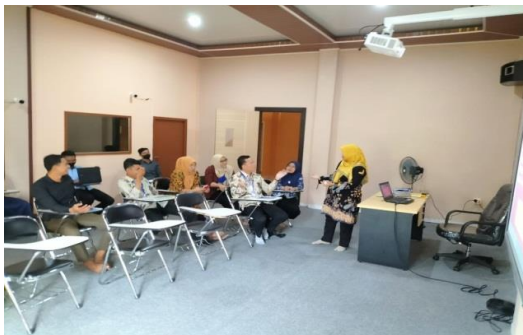
Gambar 1. Proses pembelajaran dengan melakukan brain storming

Brain storming merupakan cara yang manjur juga dalam pelatihan kepada peserta untuk membuka wawasan dan berpikir cepat. Pada poin ini pelatih mencoba memberikan topic-topik sederhana agar peserta mengambil kesempatan tersebut untuk speak up dan membeberanikan diri dalam melontrakan kalimat bahasa Inggris sehingga mereka dapat menambah kosa kata meskipun terkadang ada yang menggunakan bahasa Indonesia yang dicampur dengan Bahasa Inggris. Tindakan seperti itu sudah bagus, mereka sudah mulai terpancing dan antusias dalam berbicara bahasa Inggris sedikit demi sedikit.