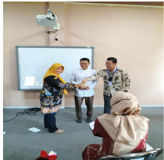
Gambar 2. Pemberian Reward bagi Peserta Pelatihan yang tampil.

Trik ini bagi penulis pribadi sangat efektif dan menyenangkan. Ketika pelatihan berlangsung ada waktunya pelatih melakukan Tanya jawab atau meminta peserta memberikan tanggapan serta memberikan contoh dalam bahasa Inggris. Bagi peserta yang mau mencoba melatih bahasa Inggrisnya akan diberikan reward. Reward yang pelatih berikan tidaklah harus mahal, yang terpenting di moment ini peserta merasa dihargai kemampuannya dan berani tampil itu sudah hal yang luar biasa. Reward yang diberikan berupa permen, dan alat tulis. Reward ini dapat memotivasi peserta pelatihan untuk mau mencoba dan mengesampingkan rasa takut salah, dan malu. Hal itu terlihat dari keinginan peserta yang merasa tertantang untuk melatih skillnya dan tidak mau kalah dengan peserta lain. Suasana yang tercipta pun semakin menyenangkan dan tidak kaku, sehingga peserta tidak merasa tertekan dalam pembelajaran di ruangan.