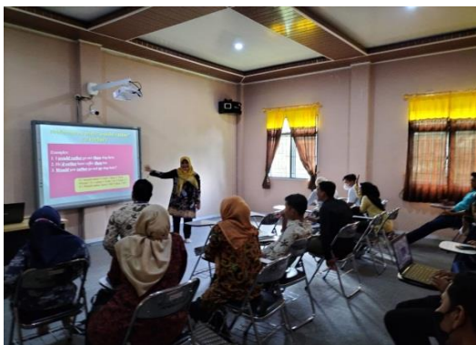
Gambar 3. Memberikan materi dengan PPT yang Menarik.

Sebagai pelatih mempunyai tanggung jawab dalam upaya peningkatan keterampilan berbahasa Inggris pesertanya, untuk itu perlu kerja keras dalam mewujudkannya. Agar peserta tetap antusias dan tidak menurun semangatnya 85 perlu dipersiapkan materi dengan penyajian yang segar dan eyes catching. Upaya ini sangat membantu peserta agar perhatiannya tidak terbagi ke yang lain. PPT yang pelatih berikan tidak monoton, diselingi dengan tampilan lucu, menarik dan memakai moving picture aplikasi. Cara ini juga terlihat menyenangkan bagi peserta, karena diakhir pembelajaran mereka ada yang berkata, “ Ms besok sajian apa lagi ya....., gambarnya gima pula yah....., penasaran untuk besok seperti apa ”. Berdasarkan pertanyaan mereka terlihat bahwa mereka mau mengikuti pelatihan terus dan terus dihari berikutnya, tentu sudah menjadi hal yang bagus juga untuk kemajuan skill mereka dengan pendukung lain seperti PPT ini.