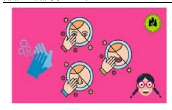
Gambar 2. Ilustrasi Media Audio Visual

Sosialisasi dan distribusi materi edukasi merupakan kegiatan inti dari pengabdian kepada masyarakat ini, di mana peserta diminta untuk menonton video singkat terkait cara pencegahan penularan COVID-19 dengan pendampingan wali siswa. Hal tersebut dilakukan untuk sekaligus mengedukasi wali siswa dalam menjaga kebersihan anak-anak terlebih dalam masa COVID-19 ini.