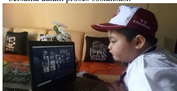
Gambar 3. Pelaksanaan Sosialisasi

Materi video edukasi didistribusikan kepada para wali siswa melalui guru Sekolah Dasar Pertiwi 2 Kota Padang melalui media whatsapp dengan diberikan arahan singkat serta formulir tanggapan. Hal tersebut dilakukan karena kondisi saat ini yang tidak memungkinkan untuk dapat berkumpul bersama dalam proses sosialisasi.