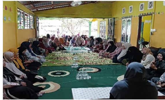
Gambar 2 : Kegiatan Pemberian Materi

Pelaksanaan kegiatan parenting class berjalan dengan lancar dan mendapat respon positif dari peserta. Kegiatan terdiri dari beberapa tahapan, yaitu penyampaian materi, diskusi kelompok, studi kasus, dan refleksi bersama. Berdasarkan hasil pelaksanaan, jumlah peserta sebanyak 25 orang tua dengan tingkat kehadiran mencapai 100%. Data awal menunjukkan bahwa 80% anak telah menggunakan gadget secara rutin, sementara 68% orang tua masih mengalami kesulitan dalam membatasi penggunaannya. Setelah pelatihan, terjadi peningkatan pemahaman orang tua terkait perkembangan anak usia dini, dampak teknologi digital, serta strategi pola asuh yang efektif. Hal ini menunjukkan bahwa kegiatan pengabdian memberikan dampak positif terhadap peningkatan kapasitas orang tua dalam pengasuhan anak.