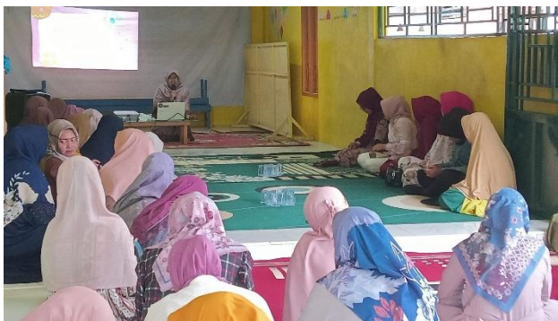
Gambar 3 : Kegiatan Pemberian Materi

Perubahan sikap orang tua dalam pengasuhan juga terlihat dari pergeseran pola asuh yang lebih positif dan terarah. Orang tua mulai meninggalkan pola asuh permisif dan beralih ke pola asuh otoritatif yang lebih seimbang antara kontrol dan kehangatan. Menurut Baumrind (1991), pola asuh otoritatif merupakan pola asuh yang paling efektif dalam mendukung perkembangan anak. Santrock (2018) juga menegaskan bahwa pola asuh ini dapat meningkatkan kemandirian dan kemampuan sosial anak. Dalam kegiatan ini, orang tua mulai menerapkan batasan penggunaan gawai dengan komunikasi yang baik kepada anak. Hal ini menunjukkan bahwa pelatihan parenting class tidak hanya meningkatkan pengetahuan, tetapi juga mengubah sikap dan perilaku orang tua. Dengan demikian, kegiatan ini memiliki dampak nyata terhadap praktik pengasuhan.