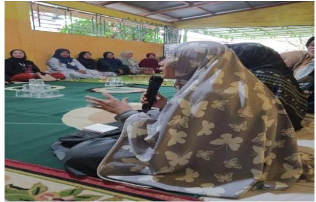
Gambar 4. Tanya jawab Peserta Orangtua

Perubahan sikap orang tua dalam mengurangi penggunaan gawai sebagai alat pengalih perhatian anak menunjukkan adanya pergeseran paradigma dalam pola asuh. Sebelumnya, penggunaan teknologi cenderung bersifat permisif tanpa batasan yang jelas, namun setelah pelatihan orang tua mulai menerapkan pola asuh yang lebih otoritatif. Pola asuh otoritatif merupakan kombinasi antara kontrol dan kehangatan yang efektif dalam mendukung perkembangan anak (Baumrind, 1991). Pola ini memungkinkan orang tua memberikan batasan yang jelas sekaligus tetap membangun komunikasi yang positif. Santrock (2018) menegaskan bahwa pola asuh otoritatif memiliki dampak positif terhadap perkembangan sosial dan emosional anak. Dengan demikian, perubahan pola asuh ini menunjukkan keberhasilan kegiatan dalam membentuk sikap pengasuhan yang lebih adaptif.