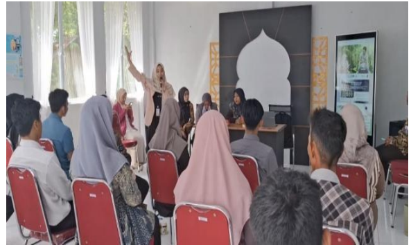
Gambar 4. Penyampaian Materi oleh Dosen Tim Pengabdian

memproses data, sehingga memberikan ruang bagi suami adalah bentuk dukungan yang efektif.