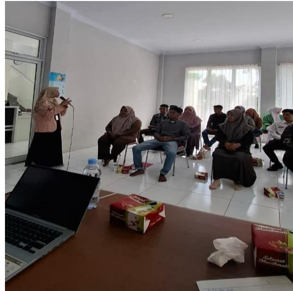
Gambar 2. Perkenalan Tim Pengabdian

serta dilanjutkan perkenalan dari pihak KUA.