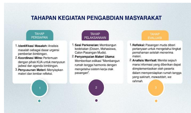
Gambar 1. Skema Pelaksanaan Bimbingan Pra Nikah di KUA Kecamatan Rambah Hilir