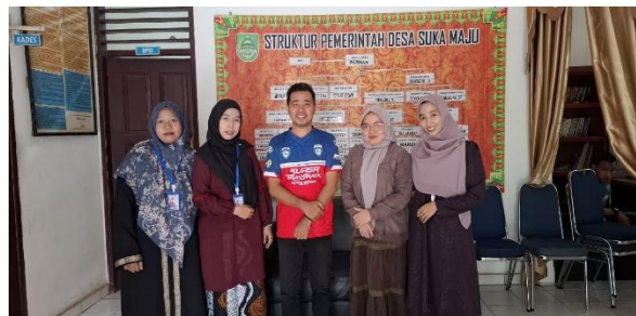
Gambar 1. Observasi Lapangan

Pelaksanaan kegiatan penelitian ini dilakukan melalui beberapa tahapan yang dirancang secara terstruktur untuk memastikan bahwa program berjalan efektif dan sesuai dengan kebutuhan remaja di Kecamatan Rambah. Tahapan pertama adalah identifikasi peserta, yang dilakukan melalui kerja sama dengan tokoh masyarakat serta organisasi kepemudaan. Teknik penentuan peserta melalui kolaborasi komunitas ini lazim digunakan dalam penelitian berbasis masyarakat (Stringer, 2014). Peserta yang dipilih merupakan remaja berusia 15–22 tahun dari Desa Rambah sebanyak 15 orang.