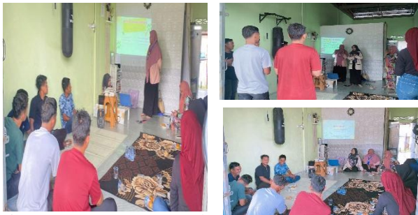
Gambar 3. Pemberian Materi Oleh Ketua Pelaksanaan

pesan-pesan edukatif dapat diterima dengan lebih mudah dan relevan.