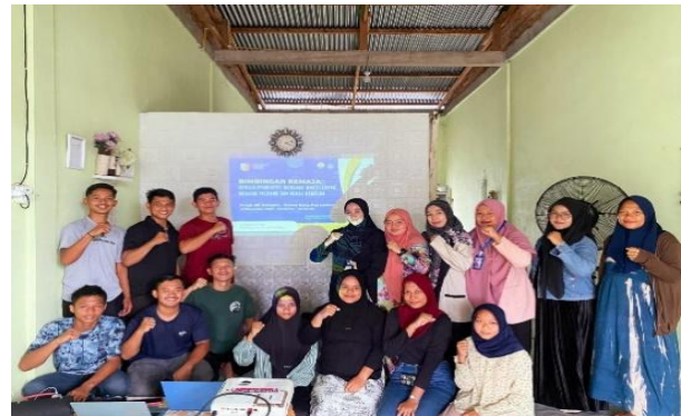
Gambar 4. Foto Bersama Dengan Pemuda dan Pemuda Kecamatan Rambah

menjelaskan dampak buruk narkoba dari aspek fisik, mental, ekonomi, hingga sosial.