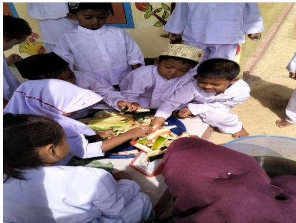
Gambar 3. Pelaksanaan praktik pembuatan eco-enzyme bersama guru

Selanjutnya pada gambar 3, anak secara bersama-sama membuat eco-enzyme. Sambil membuat dijelaskan bahan-bahan yang digunakan untuk membuat eco-enzyme diantaranya air 10 liter, sisa kulit buah/sayuran 3 kg, dan gula merah 1 kg. Setelah semua bahan tercampur, simpan di tempat yang aman dan biarkan selama 3 bulan (Mardatillah et al., 2022).