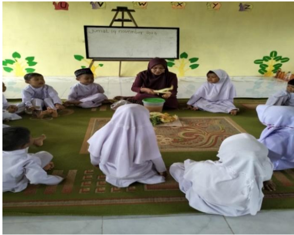
Gambar 2. Pengenalan konsep limbah organik dan manfaat eco-enzyme

Selanjutnya pada gambar 3, anak secara bersama-sama membuat eco-enzyme. Sambil membuat dijelaskan bahan-bahan yang digunakan untuk membuat eco-enzyme diantaranya air 10 liter, sisa kulit buah/sayuran 3 kg, dan gula merah 1 kg. Setelah semua bahan tercampur, simpan di tempat yang aman dan biarkan selama 3 bulan (Mardatillah et al., 2022).