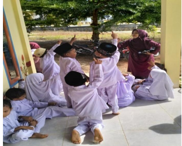
Gambar 4. Refleksi kegiatan serta penerapan dalam kehidupan sehari-hari

membuat eco-enzyme dan menanyakan kembali pada anak apa saja manfaat dari eco-enzyme.