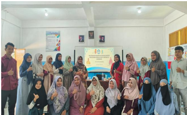
Gambar 3. Foto Bersama dengan peserta guru-guru dan Kepsek SD IT Bintang 33 Ujungbatu

Dengan metode ajar yang penulis berikan, akhirnya para guru bisa menguasai kelas dan meningkatkan keterampilan mereka baik dari segi menulis, pengucapan, dan berbicara. Seperti yang disampaikan Thornbury (2027) mendefinisikan keterampilan berbahasa sebagai kemampuan menghasilkan dan memahami bahasa secara spontan, bermakna, dan koheren dengan mempertimbangkan kecepatan, kefasihan, interaksi, dan akurasi.