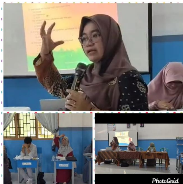
Gambar 2. Pemberian materi oleh Ketua Pelaksana

Berdasarkan hasil pre-test dan post-test, terdapat peningkatan kemampuan peserta dalam memahami kosakata dan tata bahasa dasar. Sebagian besar guru menunjukkan perkembangan dalam mengenali bentuk kalimat sederhana, penggunaan to be , pronoun , dan part of speech lainnya dalam konteks kelas.