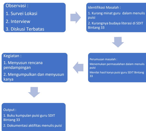
Gambar 1 : Kerangka Pemecahan Masalah

Berikut contoh timeline kegiatan penelitian berjudul: “Pendampingan Menulis Puisi untuk Guru di SD Bintang 33 Ujung Batu” disusun secara sistematis dalam bentuk tabel sesuai urutan waktu penelitian.