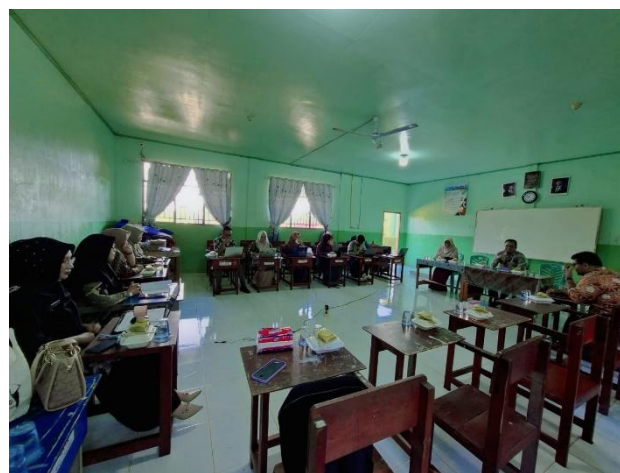
Gambar : Membimbing guru membuat draf puisi