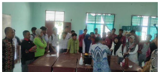
Gambar 3. Proses Pembuatan POC Urine Sapi