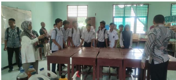
Gambar 2. Kegiatan Sosialisasi

Pelaksanaan kegiatan sosialisasi ini merupakan salah satu rangkaian kegiatan pengabdian kepada masyarakat melalui pembekalan berupa teori-teori tentang kelebihan dari limbah urin sapi dan teknik pembuatan urin sapi menjadi biourin sebagai POC serta cara aplikasinya. Tim pengabdian menjelaskan tentang penanganan limbah suatu usaha peternakan untuk mengurangi pencemaran lingkungan melalui pengolahan urin sapi menjadi produk POC serta diaplikasikan ke tanaman buah.