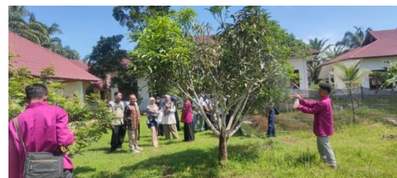
Gambar 5. Aplikasi POC ke Tanaman Buah