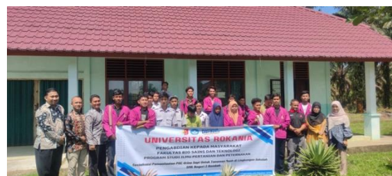
Gambar 6. Fot Bersama Tim PKM dan Siswa/Siswi SMK Negeri 2 Rambah