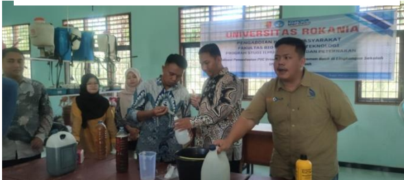
Gambar 4. Proses Pencampuran POC dengan Air

Campur 10 ml bagian POC dengan air 5 liter, lalu siramkan pada tanaman. Penyiraman dilakukan setiap satu minggu sekali.