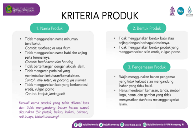
Gambar 6 Kriteria Produk