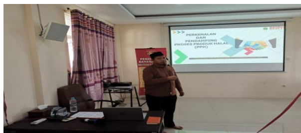
Gambar 1 Penyampaian Materi oleh tim Pengabdian

Beberapa materi pelatihan dan pendampingan yang cukup penting, yang disampaikan dalam kegiatan ini, antara lain mengenai (1) Alur proses dan dokumen yang disyaratkan (2) Pengetahuan Bahan & Praktek Pengisian Daftar Bahan (3) Proses Produk Halal (4) Verifikasi dan Validasi & Praktek Pengisian Manual SJPH (5) .