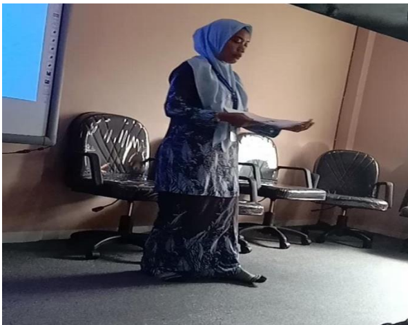
Gambar 3. Siswa mengikuti arahan guru