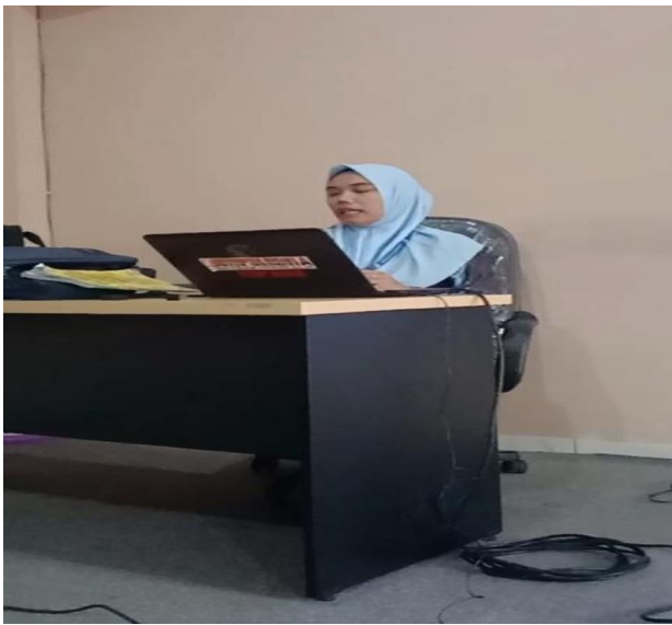
Gambar 1. Guru memandu siswa.

Pelaksanaan penerapan strategi Penilaian Instan terlebih dahulu menyediakan menentukan topik pembahasan yang akan menstimulasi rasa ingin tahu siswa dengan mendorong mereka untuk memikirkan tentang sebuah jawaban.