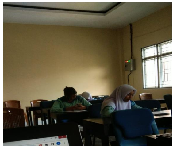
Gambar 2. Kegiatan Praktik Menulis Cerpen