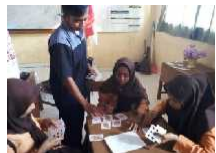
Gambar 2. Latihan Permainan Mini Bridge