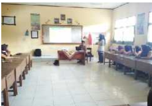
Gambar 1. Penjelasan Olahraga Bridge