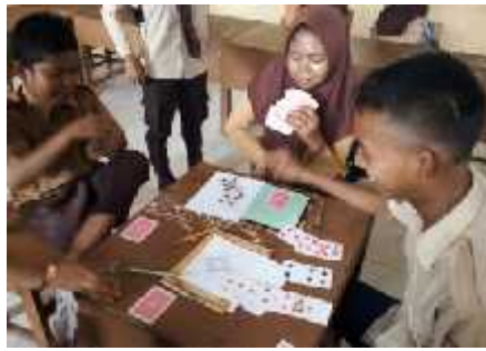
Gambar 3. Pertandingan Mini Bridge