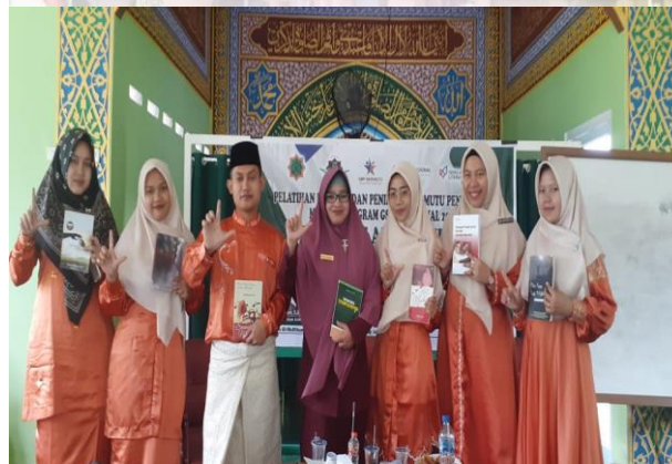
Gambar 1. Pendampingan Menulis Esai dan Puisi

Berdasarkan hasil tersebut terjadi peningkatan keterampilan menulis esai dan puisi guru dan siswa setelah mendapat pelatihan. Hasil pembahasan proses dan hasil pembelajaran menulis esai dan puisi pada tabel di atas membuktikan bahwa masalah sudah dapat diatasi, karena hasil dan proses sudah meningkat. Meningkatnya hasil dan proses pembelajaran keterampilan menulis esai dan puisi terjadi karena pelatih melakukan penyuluhan dan pelatihan dengan bertahap