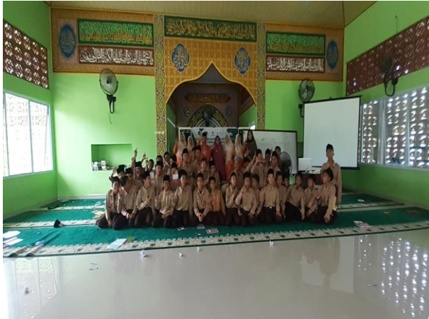
Gambar 2. Penutupan Menulis Esai dan Puisi