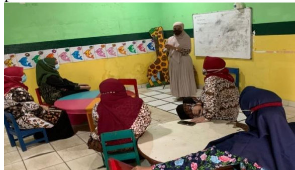
Gambar 1. Pembukaan Acara Pelaksanaan Sosialisasi

Pertemuan selanjutnya, kami mulai melakukan sosialisasi, pelatihan, dan evaluasi. Kami melakukan kegiatan Pengabdian kepada Masyarakat ini di TK Dian Pratama, Jalan Penganten Ali No.7 Ciracas Jakarta Timur. Pelaksanaan Pengabdian kepada Masyarakat dilakukan pada Rabu, 22 Desember 2021 pukul 10.00 s/d Selesai WIB. Gambar 1 menunjukkan salah satu Tim Pengabdian kepada Masyarakat sedang membuka acara pelaksanaan sosialisasi.