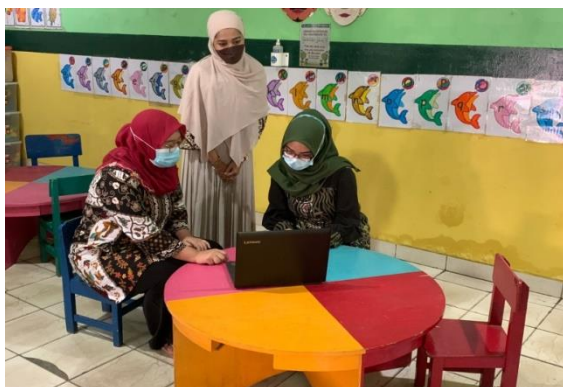
Gambar 4. Pengamatan dan Pembimbingan terhadap Peserta Sosialisasi

Pada saat dibuka sesi tanya jawab, Tenaga Pengajar TK Dian Pratama antusias bertanya tentang Quizizz dan bagaimana pengaplikasiannya. Gambar 4 menunjukkan salah satu Tim Pengabdian kepada Masyarakat sedang mengamati dan membimbing Tenaga Pengajar TK Dian Pratama yang sedang mencoba mengakses dan mengaplikasikan Quizizz.