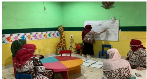
Gambar 2. Pemaparan Materi Sosialisasi

Pada pertemuan ini, kami melakukan sosialisasi dengan memaparkan materi tentang Quizizz dan Pemanfaatannya, Pengaplikasian Quizizz, dan Pembelajaran Pengenalan Huruf di Aplikasi Quizizz. Gambar 2 menunjukkan pemateri sedang memaparkan materi sosialisasi.